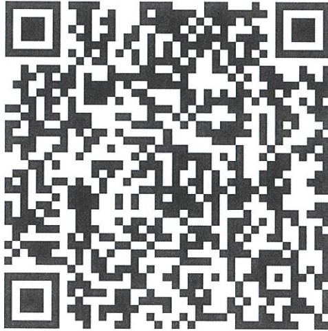
报名通道二维码图片