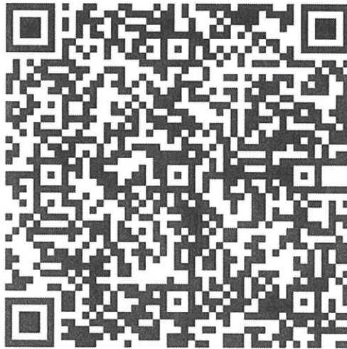
学习交流微信群二维码（实名制）